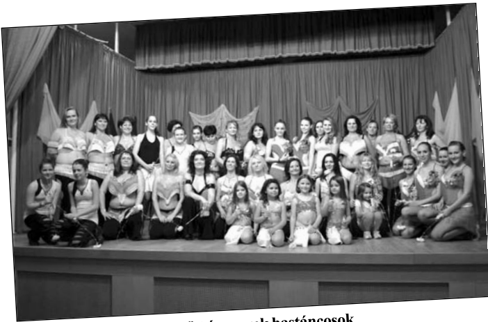
Felnőtt és gyerek hastáncosok