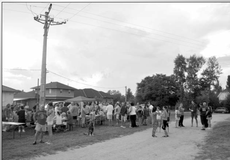
Átadásra került a Jókai és a Rákóczi utca