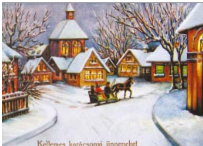
Kellemes karácsonyi ünnepeket