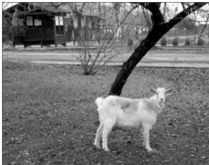
Költségkímélő környezetbarát fűnyírás a Délegyházi buszforgalomban