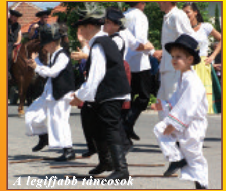
A legifjabb táncosok