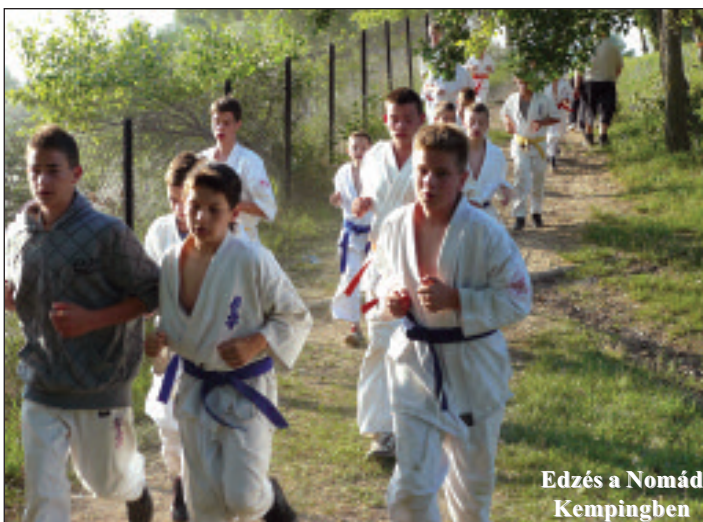
Edzés a Nomád Kempingben