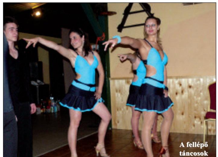
A fellépő táncosok