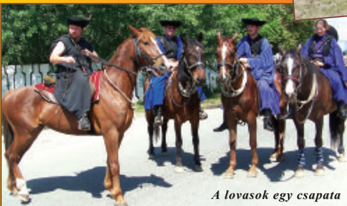
A lovasok egy csapata