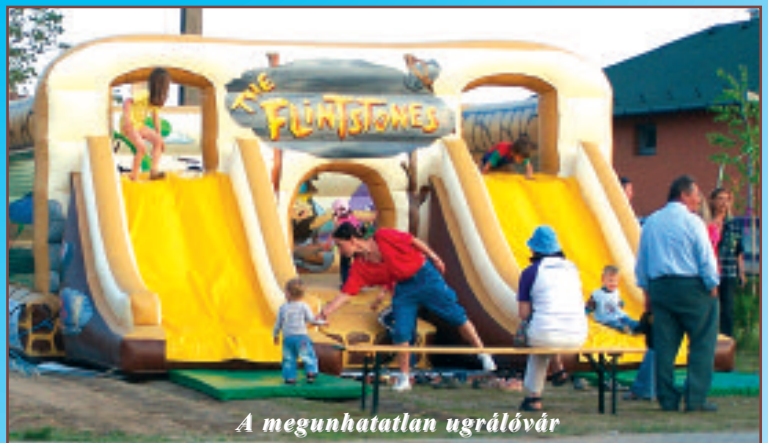
A megunhatatlan ugrólóvár

Gratulálunk a nagyszerű májusi rendezvényekhez!