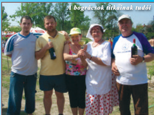
A bográcsok titkainak tudói