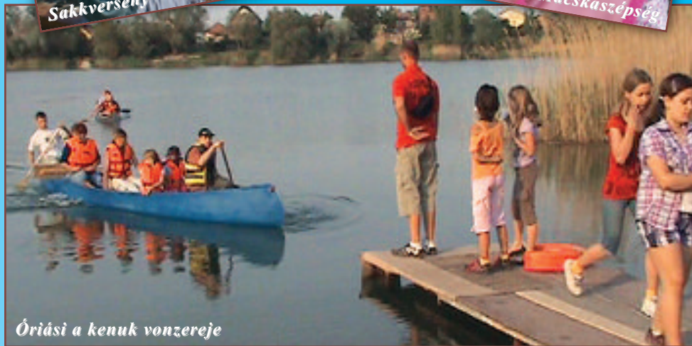
Óriási a kenuk vonzereje