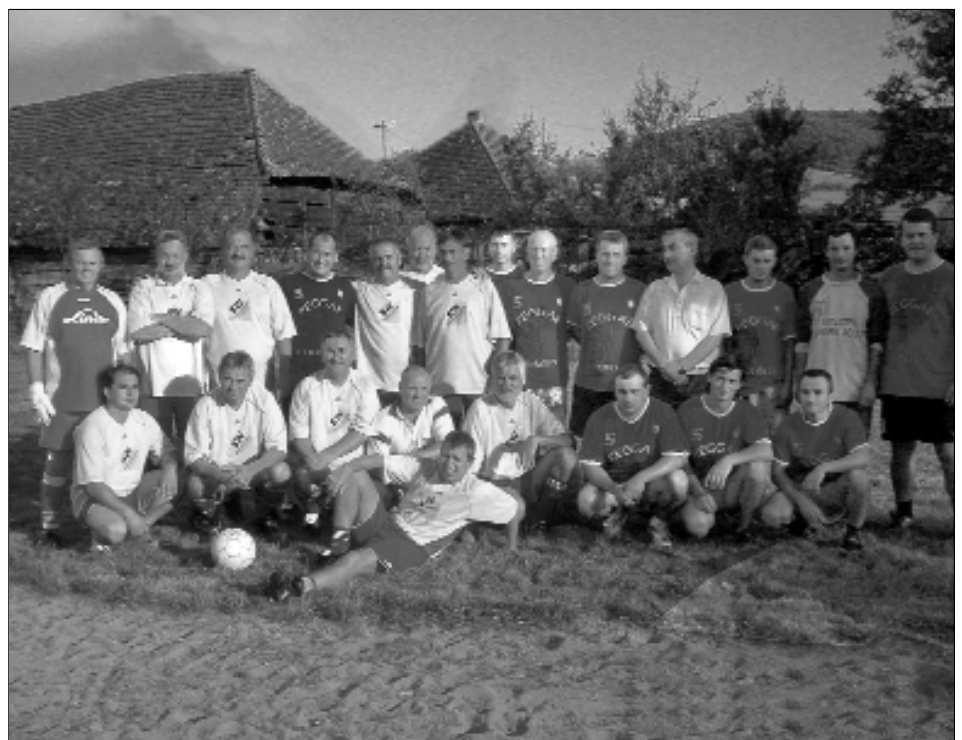
KIBÉD – DÉLEGYHÁZA VÉGELGYENGÜLÉS 2-3