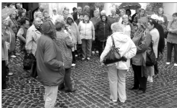
Vasárnap reggel már a Rákóczi-várban ért minket az őszi eső