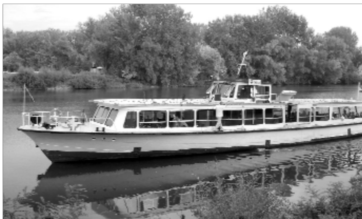
Csoportunk hajója indul a Bodrogra