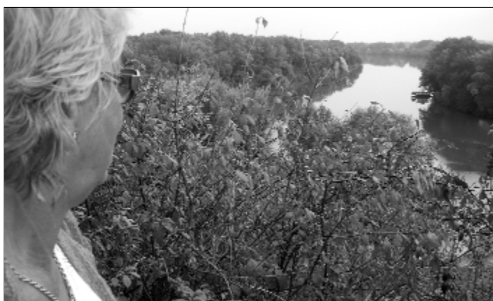
Így néz ki a kilátóból a Bodrog és a Tisza összefolyása a Szent Erzsébet híd mellett Tokajnál