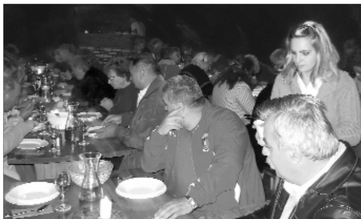
BorvacSORa a Borgalériában