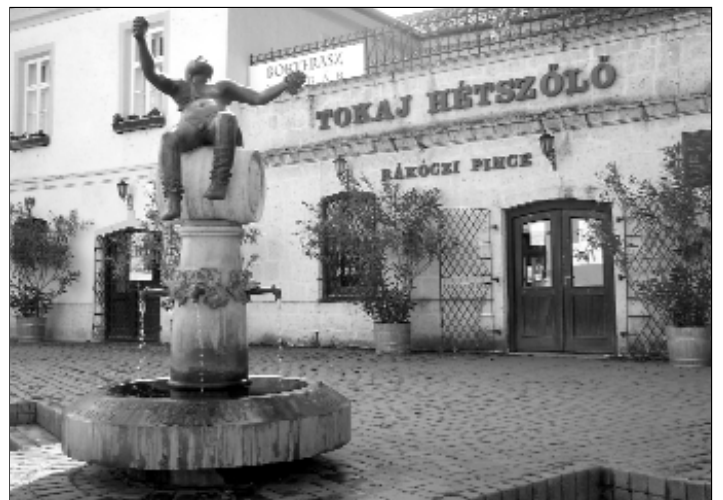
A Rákóczi Pince Tokaj főterén