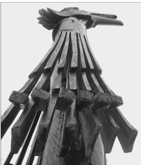
Európa mértani közepét jelzi a szobor Tállyán