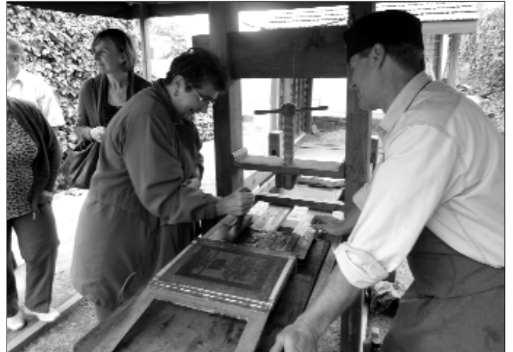
Sajtó alatt a Vizsolyi Biblia!