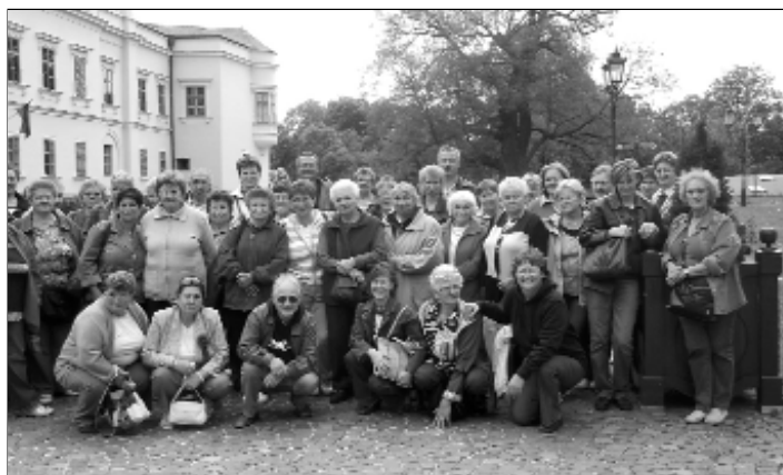
Együtt a fáradt, de a Rákóczi – vártól elbűvölt csapat a parkban