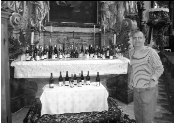
A tokaji borok szentelésére készülnek a Szt. Vencel-napi búcsún a tállyai templomban

Képekben szeretnénk mesélni a Tállya-Tokaj-Sárospatak útvonalon tett kellemes kirándulásunkról.