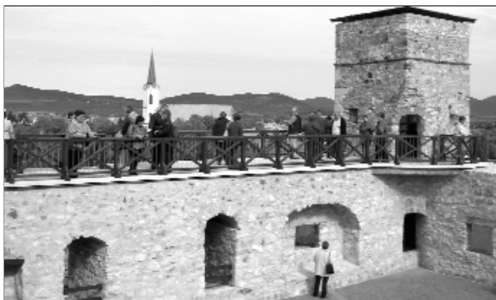
Végre feljutottunk a Vörös-toronyba!