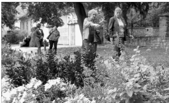
De gyönyörűek voltak a virágos pataki utcák!