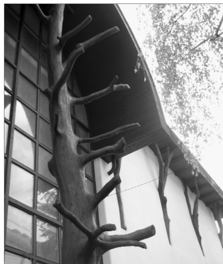
Makovecz Imre stílusa meghatározó Patak XX. századi építészetében