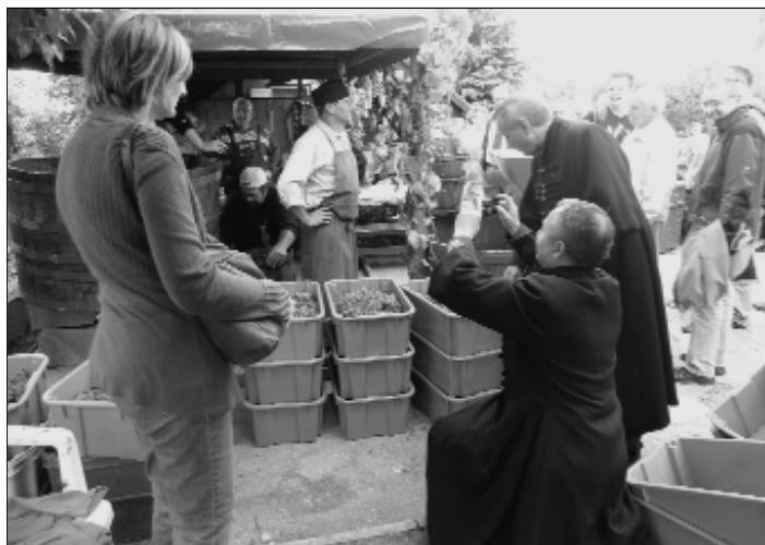
A Tokaji Borrend Lovagjai Krakkóból is hívtak kíváncsi vendégeket