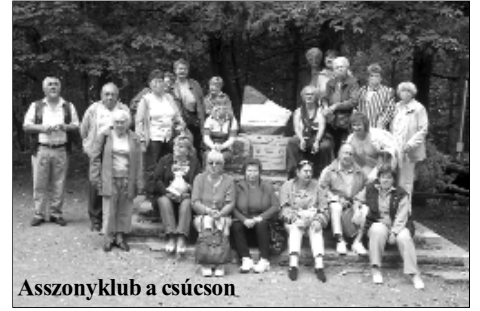
Asszonyklub a csúcson

tájáról gyönyörű népviseletbe öltözött fiatal lányok, asszonyok hozták el más-más módon feldíszített hordozható Mária-szobraikat, amit a reggeli körmenet után bemutattak a templomban, közben énekeltek, imádkoztak. Meghatóan szép volt. Ezután a rendkívül igényesen felújított Mátra Múzeumba mentünk. Itt annyi volt a látnivaló, hogy még legalább egy fél napot el tudtunk volna barangolni, nézelődni a kiállított növények, állatok és tárgyak között. Sajnos haza kellett indulnunk, de úgy gondolom, hogy majd valamennyien szívesen gondolunk vissza az együtt töltött hangulatos két napra.