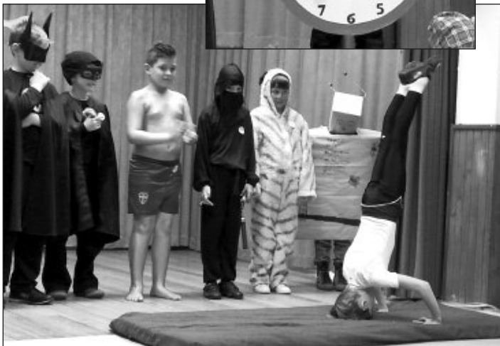
A második osztály