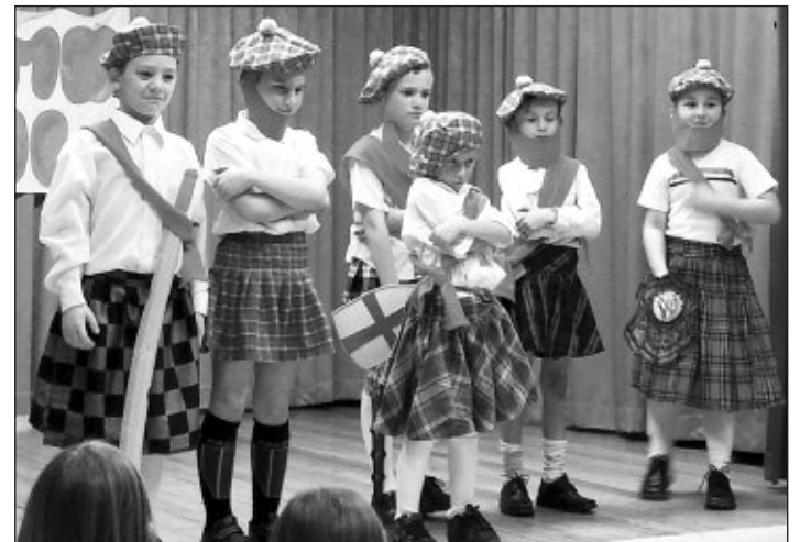
Skót vendégeink is voltak